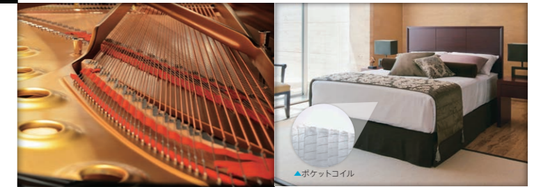
▲ピアノ線・硬鋼線(左:ピアノ弦、右:ベッドスプリング)

また、当社グループで製造する自動車用高級ばね材料向け素材は、世界トップクラスのシェアを誇ります。