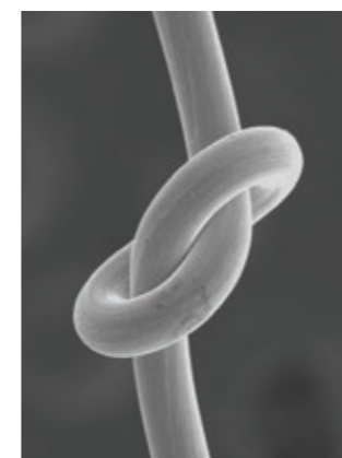
SWP-EX セイントSG (0.060mm)